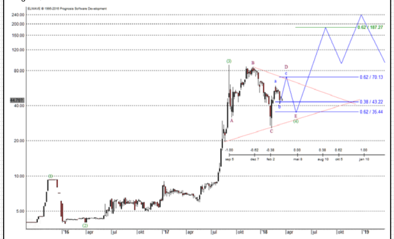
Chart letzter Analyse, 19.03.2018