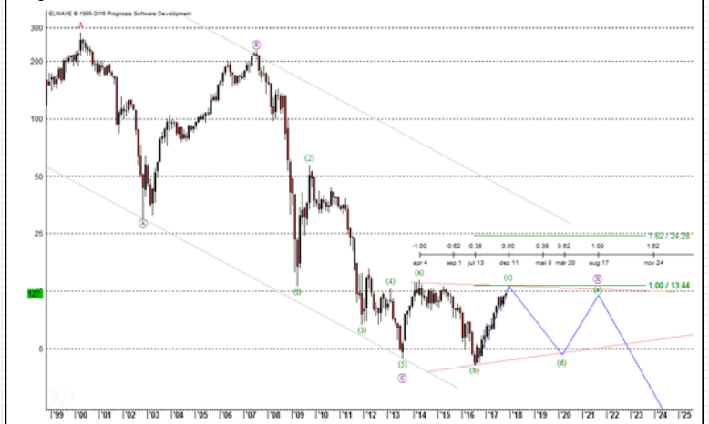
Chart letzter Analyse, 14.06.2018