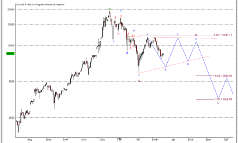
Chart letzter Analyse, 11.04.2018