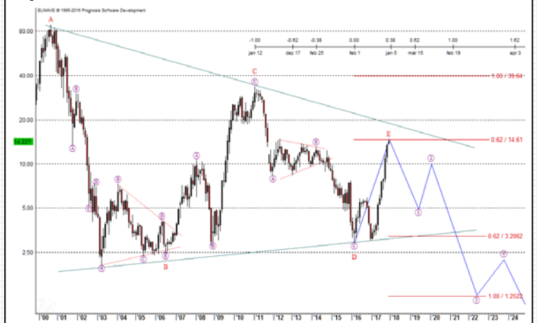
Chart letzter Analyse, 11.09.2018