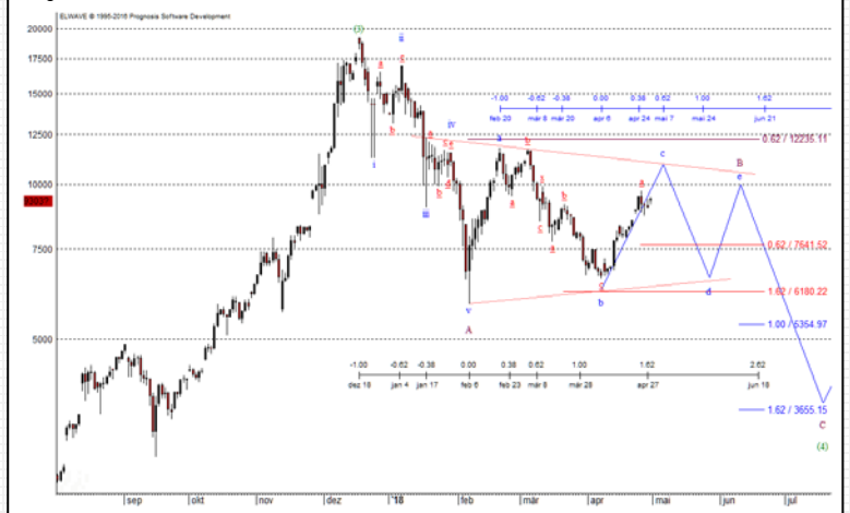
Chart letzter Analyse, 24.09.2018