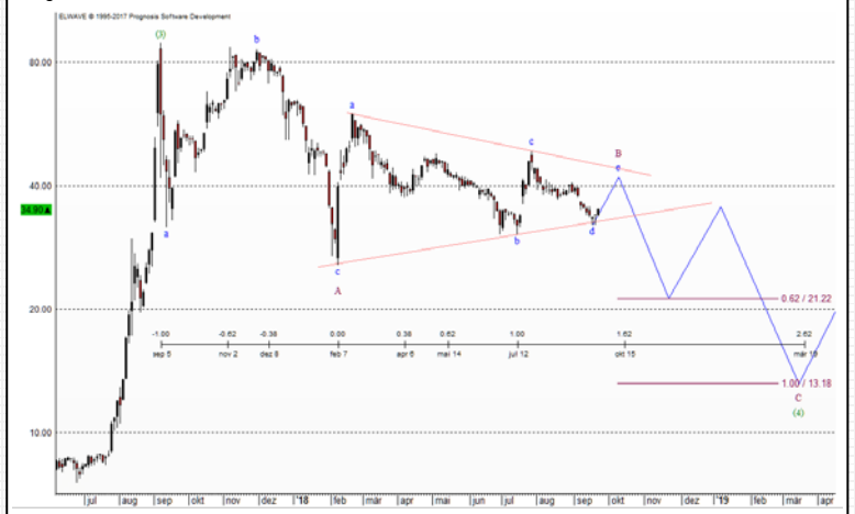
Chart letzter Analyse, 28.03.2019