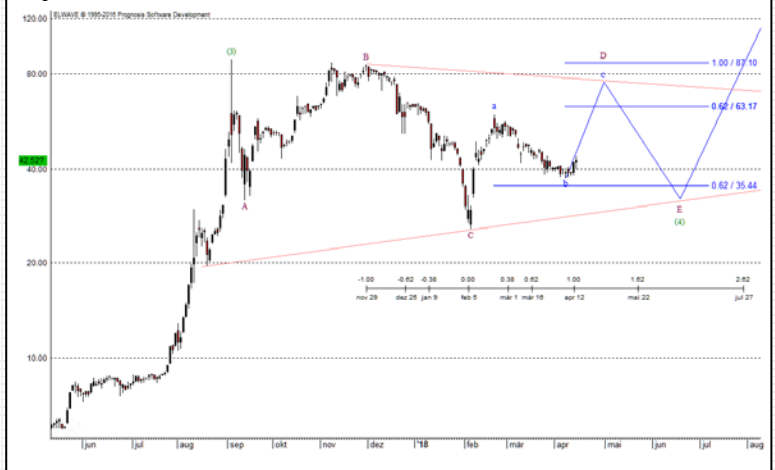
Chart letzter Analyse, 22.09.2018