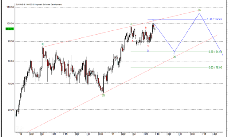
Chart letzter Analyse, 19.06.2018