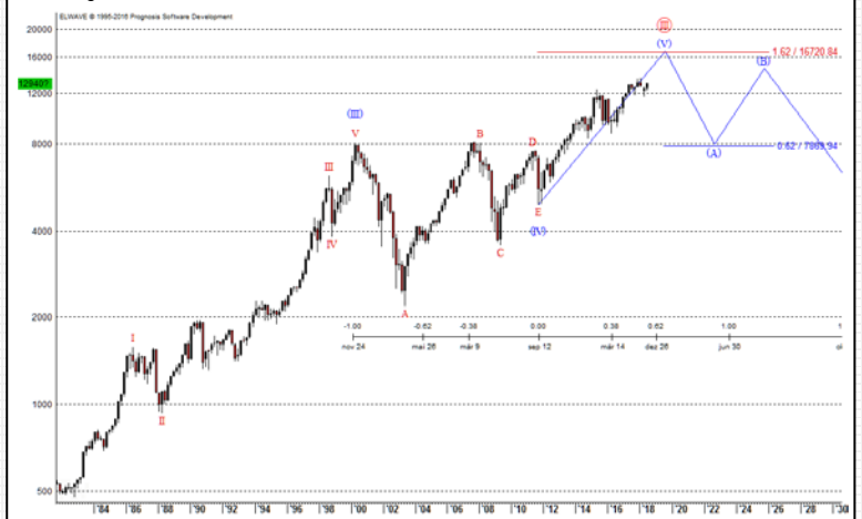
Chart letzter Analyse, 17.04.2018