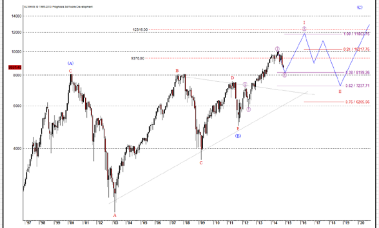
Chart, vom 31.03.2015