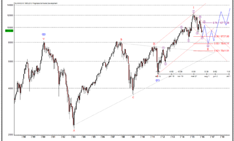
Chart letzter Analyse, 13.02.2016