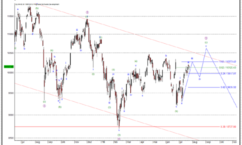
Analyse, vom 02.09.2016