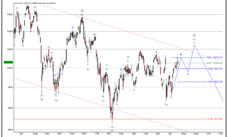
Analyse, vom 02.09.2016