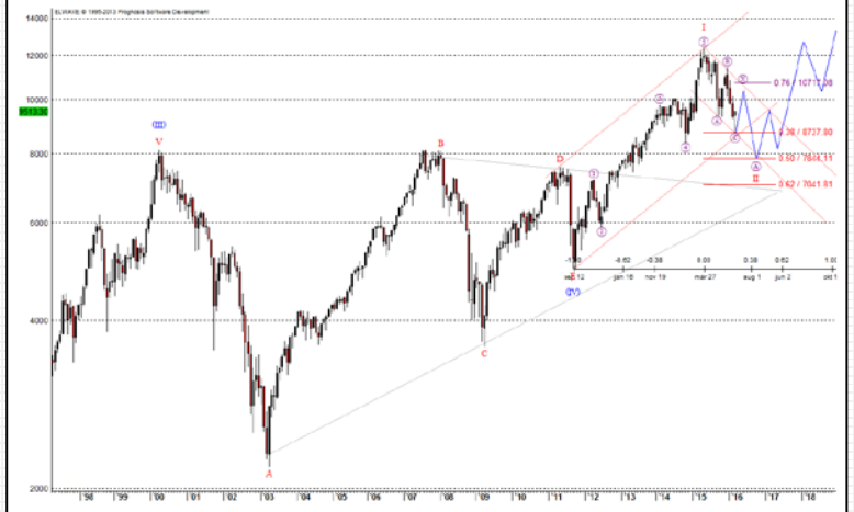
Chart letzter Analyse, 13.02.2016