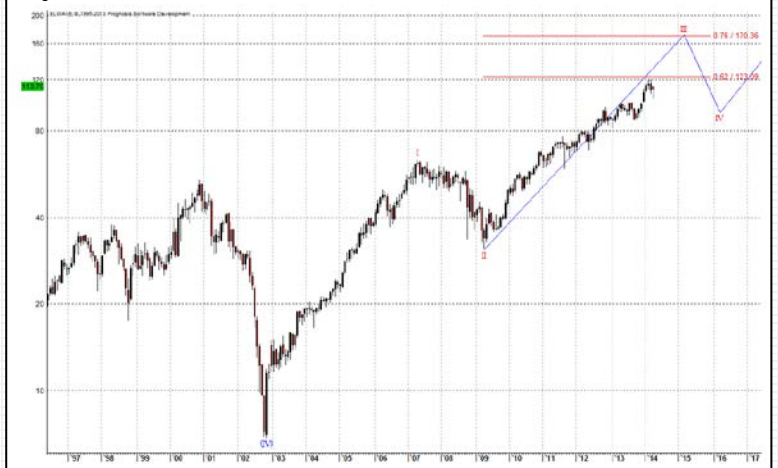
Chart letzter Analyse, 19.06.2018