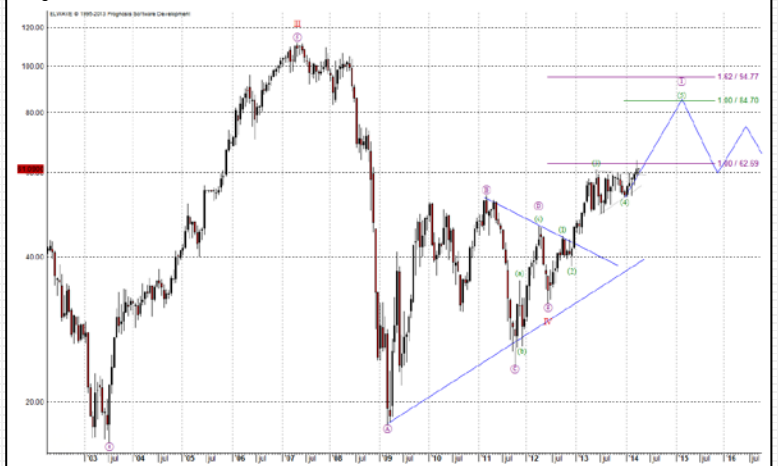
Chart letzter Analyse, 19.06.2018