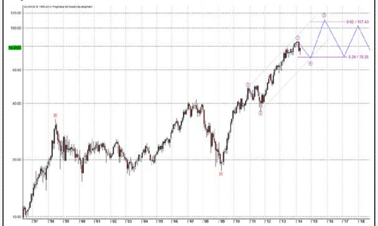
Chart letzter Analyse, 19.06.2018