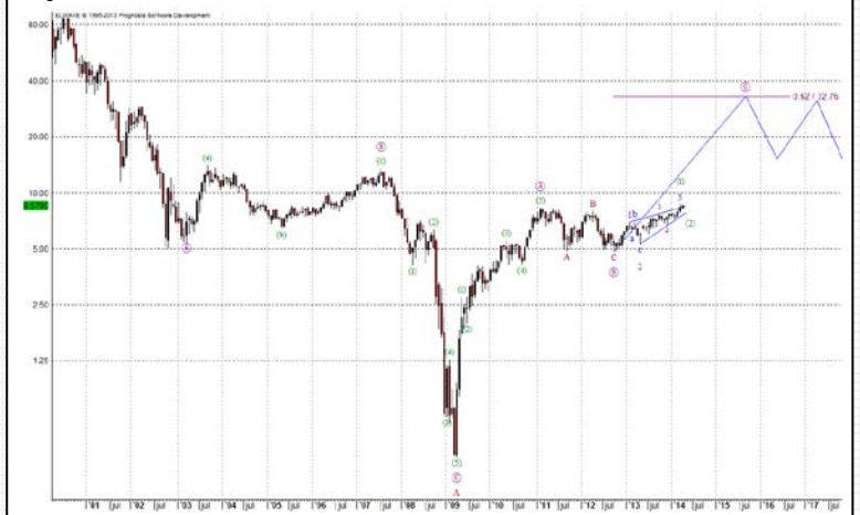
Chart letzter Analyse, 30.06.2018