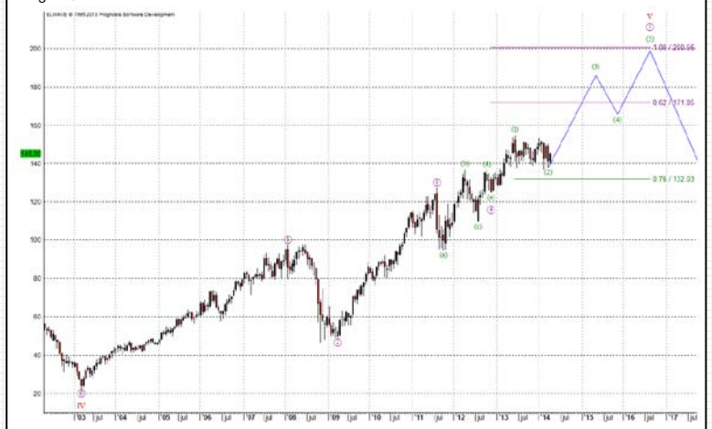
Chart letzter Analyse, 26.06.2018