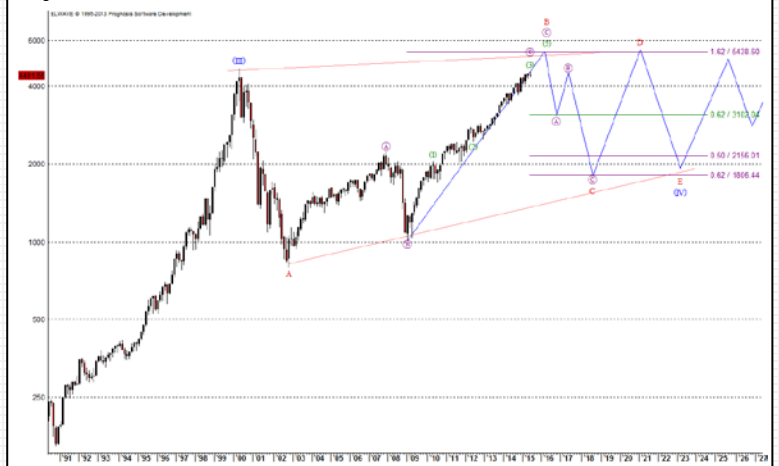
Chart letzter Analyse, 12.01.2018