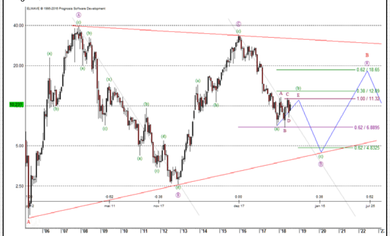
Chart letzter Analyse, 10.08.2018