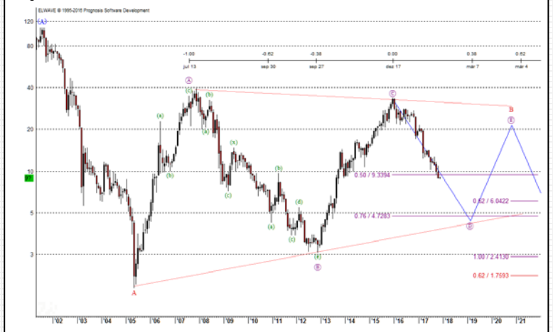
Chart letzter Analyse, 25.03.2018