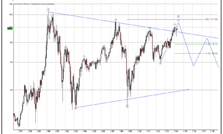
Chart letzter Analyse, 26.06.2018