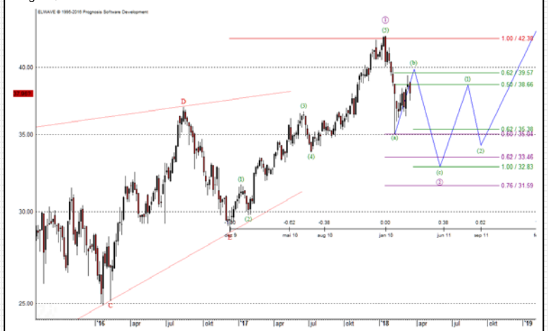
Chart letzter Analyse, 26.06.2018