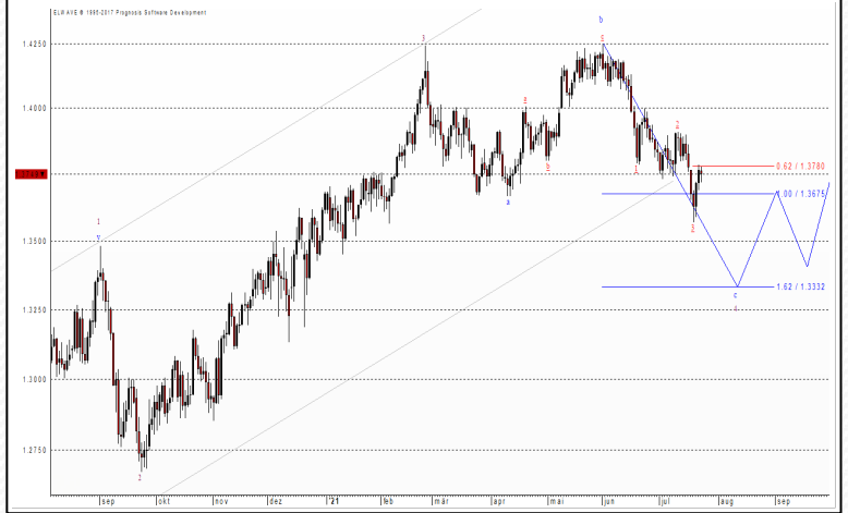
Chart letzter Analyse, 28.03.2020